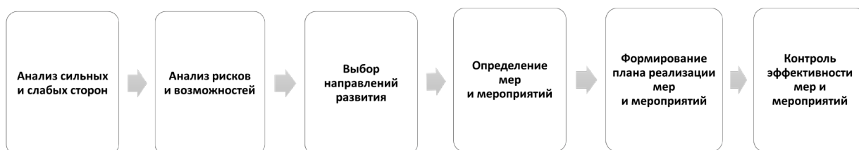
Рисунок 3. Планирование комплексного развития ДОО

Адресные рекомендации экспертов и других участников МКДО позволяют выстроить качественный управленческий цикл и спроектировать дорожную карту развития организации.