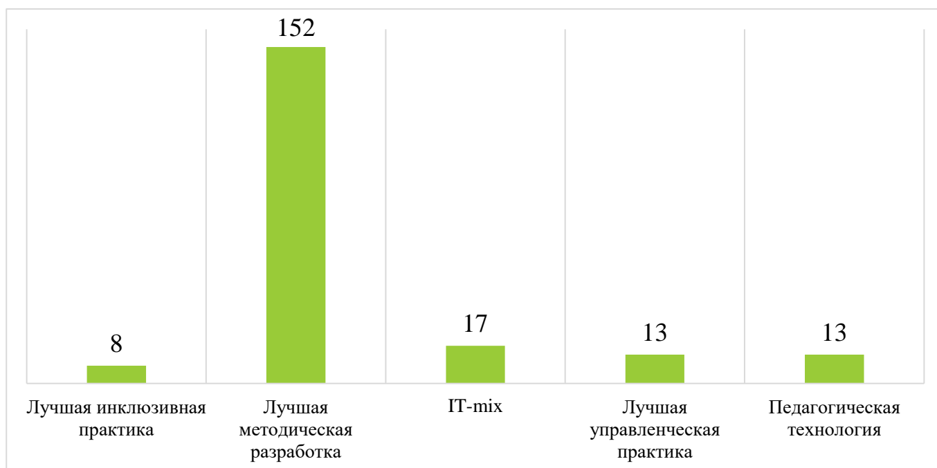
Диаграмма 3. Количество представленных работ в разрезе номинаций

Более половины (75% от всех работ) в 2022 году было представлено в номинации «Лучшая методическая разработка» (152 педагогических и управленческих практик) – это в 4 раза больше, чем в 2021 году по этой номинации. Наименьшее количество – в номинации «Лучшая инклюзивная практика» (8 работ в данной номинации).