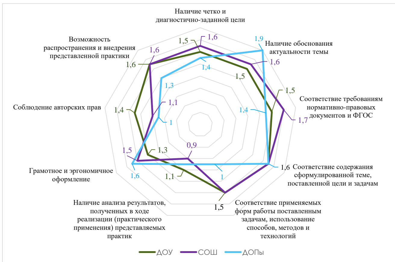
Диаграмма 5. Среднее значение баллов по результатам оценки экспертной группы в разрезе образовательных учреждений

У представителей учреждений дополнительного образования был отмечен дефицит по критериям «Соответствие применяемых форм работы поставленным задачам, использование способов, методов и технологий, обеспечивающих эффективность и мотивацию обучающихся (воспитанников) или работников», «Наличие анализа результатов, полученных в ходе реализации (практического применения) представляемых практик», «Соблюдение авторских прав». Практически у половины педагогов учреждений дополнительного образования по этим номинациям отмечены дефициты (согласно протоколам членов жюри). Но, в тоже время, участники из учреждений дополнительного образования в текущем году наиболее полно обосновали актуальность выбранной темы.