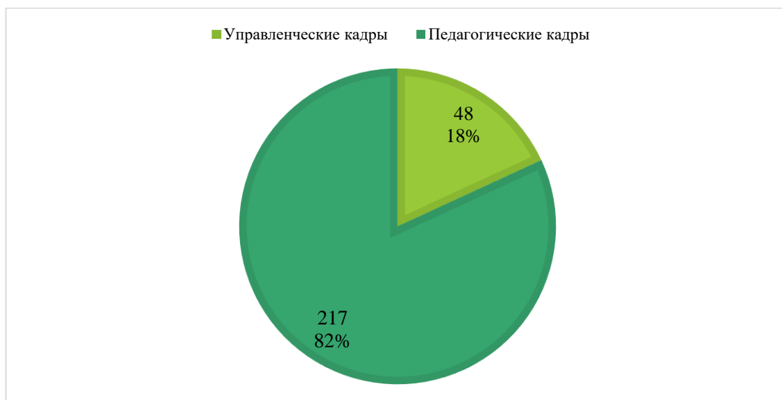
Диаграмма 2. Количество педагогических и управленческих кадров, принявших участие в Фестивале в 2022 году

Данные по количеству представленных работ в разрезе номинаций по образовательным организациям представлены в таблице 3.