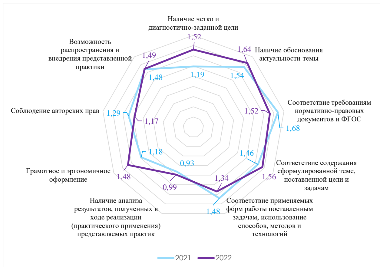
Диаграмма 6. Средние значения баллов по результатам оценки экспертной группы в сравнении с 2021 годом

Аналогично анализу протоколов Фестиваля в 2021 году, члены экспертной группы при оценке практик в 2022 году отмечали нечеткое формулирование цели. Но, если в 2021 году только в 30 % представленных работ цель сформулирована конкретна и диагностично задана, то в текущем году такое количество увеличилось до 57 %. Увеличение показателя обосновано в том числе за счет проводимых перед организацией Фестиваля мероприятий.