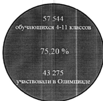
Рис. 2. Доля обучающихся-участников школьного этапа олимпиады от общей численности обучающихся 4-11 классов

Согласно сведениям федеральной отчетности ОО-1 в 2024-2025 учебном году численность обучающихся 4-11 классов в подведомственных Управлению образования общеобразовательных организациях составила 57 544 обучающихся, соответственно доля обучающихся-участников школьного этапа Олимпиады – 75,20%. Это меньше, чем в прошлом учебном году на 0,24% (55 147 – обучающихся 4-11 классов, 41 601 – обучающихся-участников школьного этапа, 75,44% - доля обучающихся-участников).