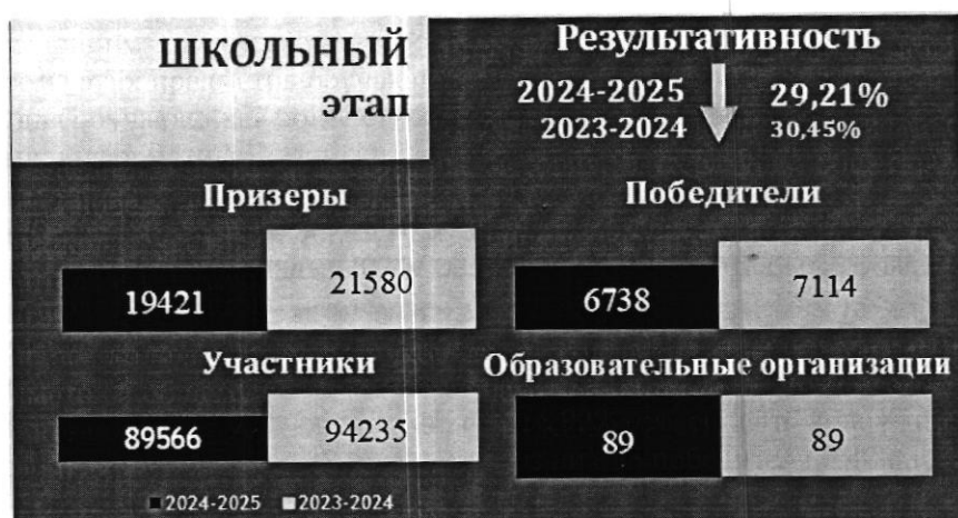
Рис.1. Итоги школьного этапа олимпиады в 2024-2025 учебном году

предметах, общее количество участий составило 89 566 раз (на 4669 участника меньше, чем в прошлом году). Общее количество призеров – 19 421 (на 2159 призеров меньше, чем в прошлом году), победителей – 6 738 (на 376 победителей меньше, чем в прошлом году).