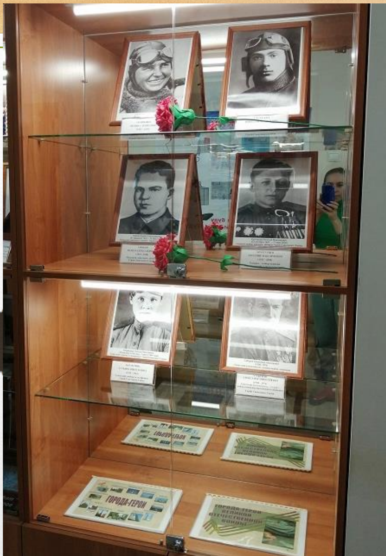
«Улицы города, названные в честь Героев Советского Союза»