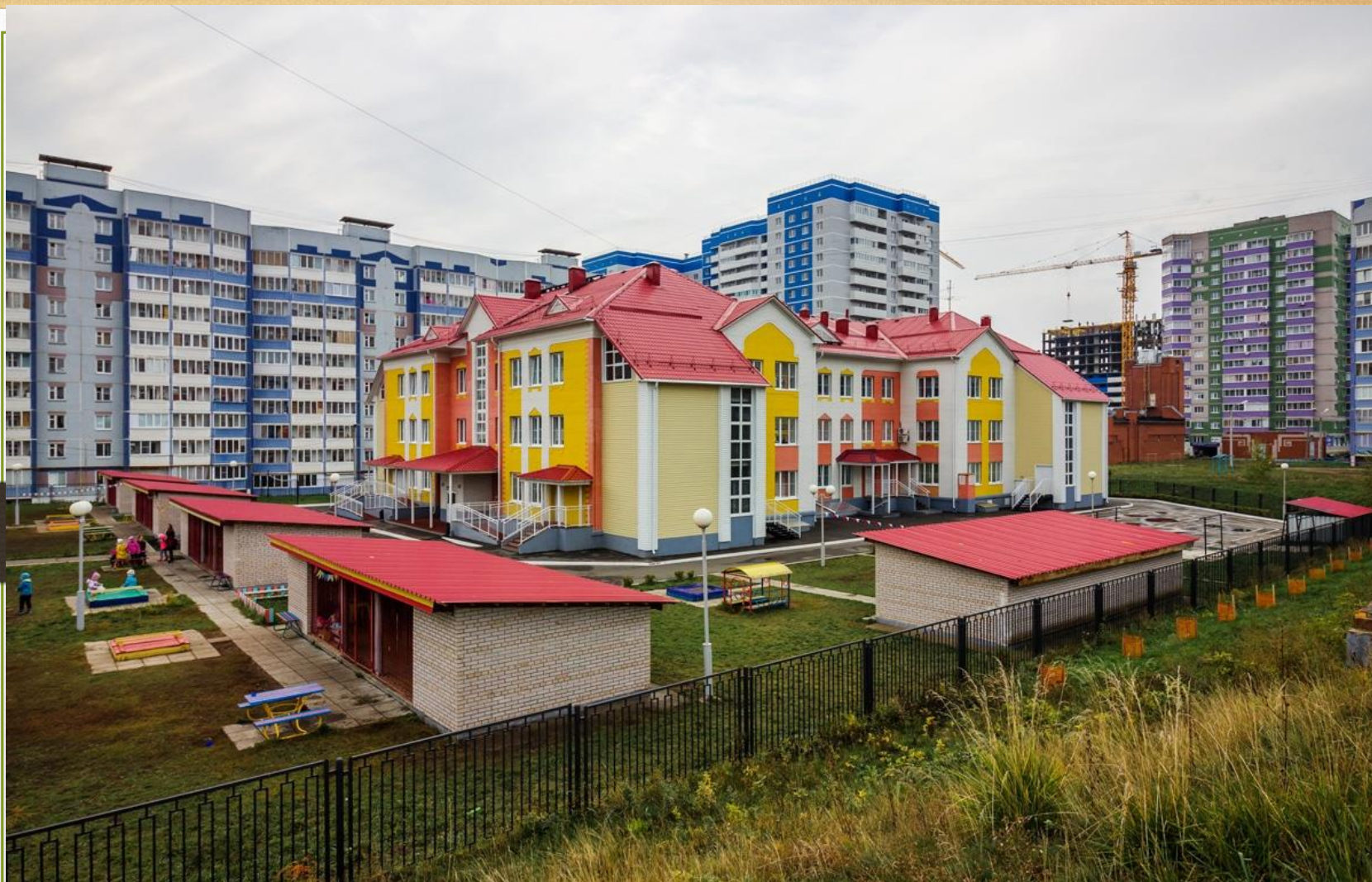
Присвоение имени Героя России Ильфата Закирова детскому саду № 11, март 2019 года