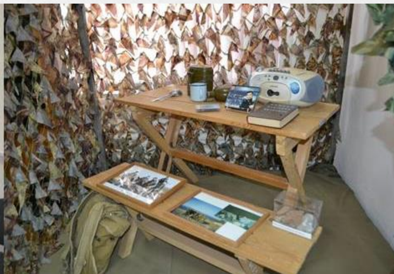
Музей в МБОУ СОШ № 55