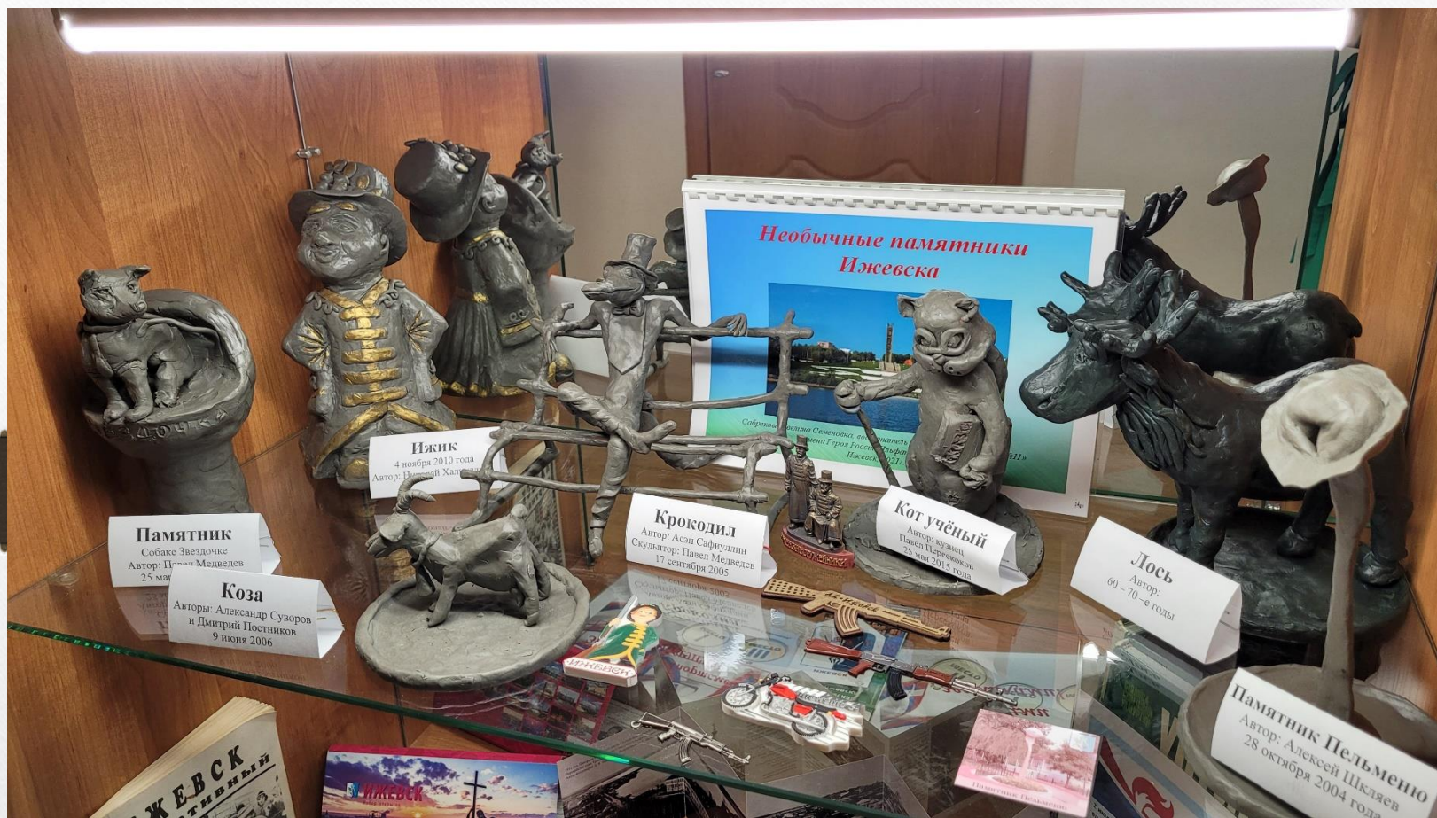
«Необыкновенные памятники города Ижевска»