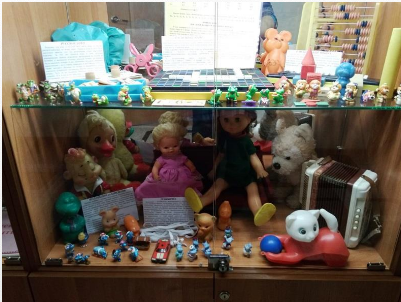
«Игрушка маминого детства»