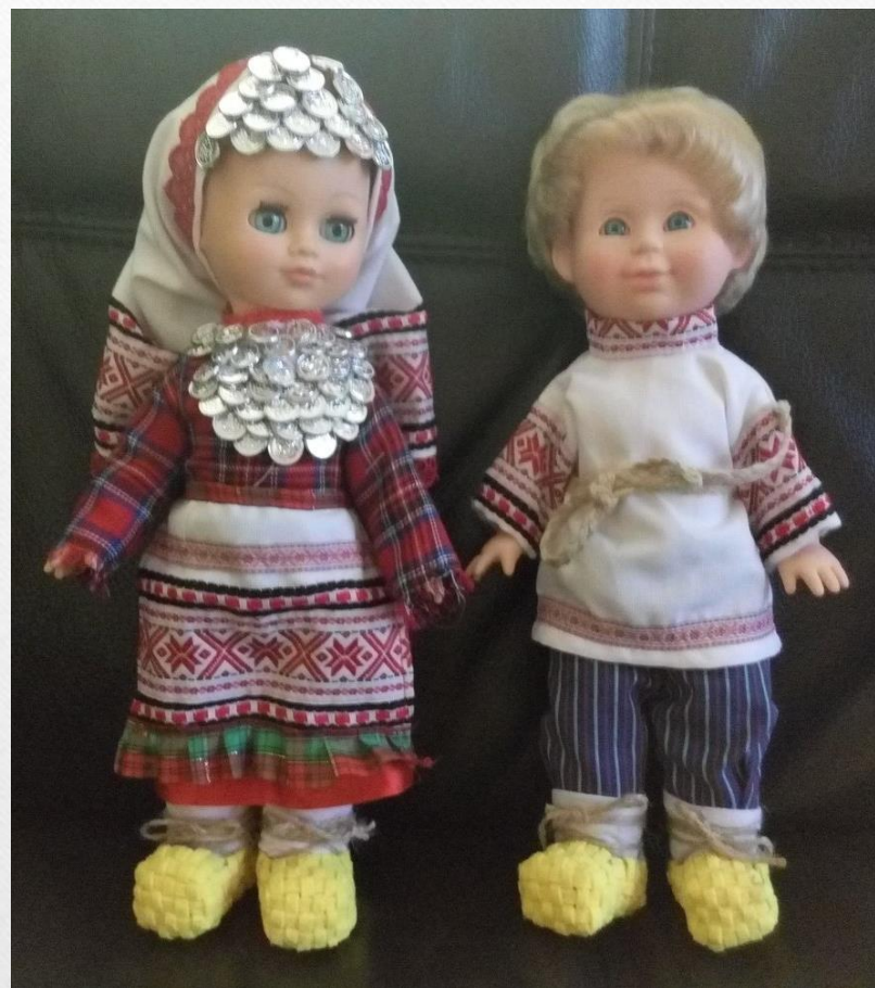
«Край мой родниковый»