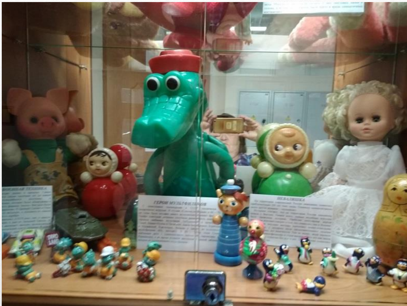
«Игрушка маминого детства»