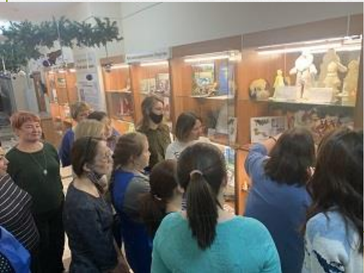
«История елочной игрушки»