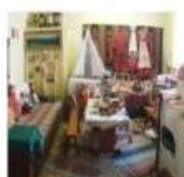
Комната - музей