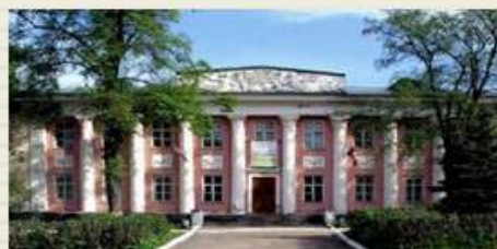
Удм. Респ. музей изобразительных искусств

информация на электронном носителе о музее, который существует реально (сайты музеев) или только в сетевом пространстве.