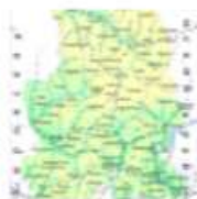
Путешествуем по Удмуртии