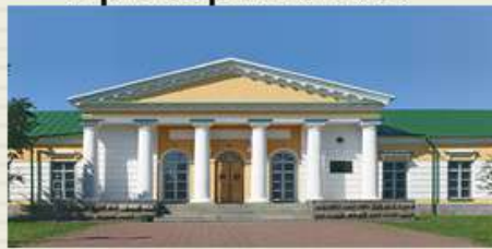
Национальный музей УР им.К.Герда