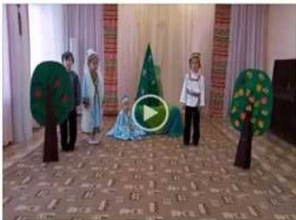
Удмуртская легенда "Легенда о хрезе"