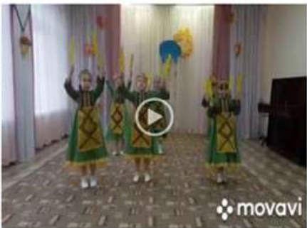
Удмуртская народная сказка "Мышь и воробей"