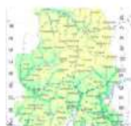
Путешествуем по Удмуртии