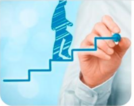
Целевая модель наставничества