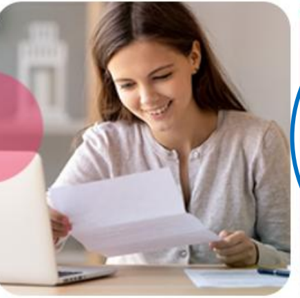
Конкурсы и фестивали