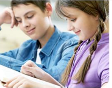
Одаренные дети. ВСОШ