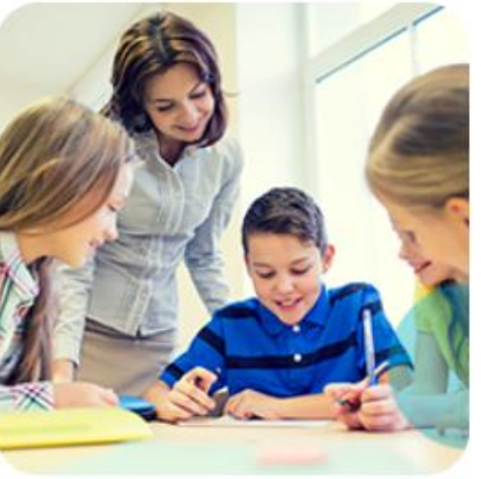
Центр дополнительного образования